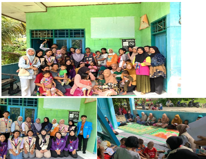
Gambar 2. Kegiatan penyuluhan tentang Gizi seimbang pada masyarakat untuk memberikan gambaran pada masyarakat untuk diaplikasikan di menu sehari-hari

Adapun realisasi pemecahan masalah dalam kegiatan pengabdian kepada masyarakat ini sesuai dengan permasalahan Kelompok Masyarakat Sasaran dan solusi yang telah ditawarkan adalah sebagai berikut.