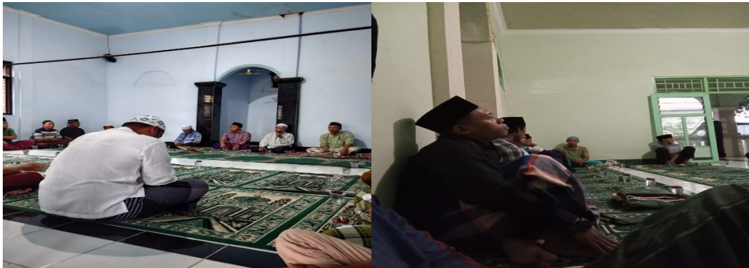
Gambar 3. Kegiatan Pengabdian kepada Masyarakat di Musholla Nurul Huda Lingkungan Jorong RT 42 Kelurahan Pancor Kecamatan Selong, Kabupaten Lombok Timur

dana. Setelah kegiatan, transparansi meningkat secara signifikan, dengan skor 3, yang mencerminkan tingkat kepuasan tinggi dari jemaah dan donatur. Indikator ketiga, Partisipasi Masyarakat, juga mengalami peningkatan yang signifikan setelah kegiatan. Sebelum pendampingan, partisipasi masyarakat dalam kegiatan musholla masih rendah, dengan skor 1. Setelah adanya pelatihan dan pendampingan, partisipasi meningkat, terlihat dengan semakin semaraknya kegiatan sholat berjamaah, yang tercermin pada skor 3. Grafik ini menggambarkan perubahan yang jelas pada ketiga indikator, menunjukkan bahwa pendampingan dalam pengelolaan keuangan tidak hanya memperbaiki kualitas administrasi keuangan, tetapi juga meningkatkan transparansi dan partisipasi masyarakat.