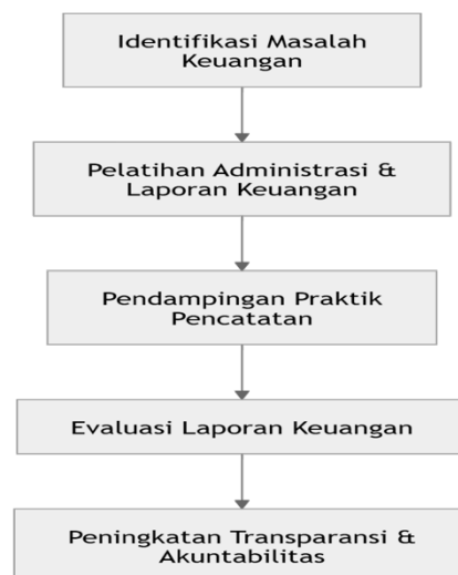
Gambar 1. Proses Pelaksanaan Pengelolaan Keuangan di Musholla Nurul Huda

Masalah yang dihadapi oleh Musholla Nurul Huda adalah belum ada sistem administrasi dokumen keuangan yang baik, serta belum ada laporan keuangan yang memadai. Untuk mengatasi masalah tersebut, solusi yang diberikan berupa pelatihan dan pendampingan dalam pembuatan dan pengisian dokumen administrasi keuangan, serta pelatihan mengenai penyusunan laporan keuangan musholla yang sesuai dengan standar yang berlaku. Pendekatan ini bertujuan untuk meningkatkan keterampilan pengurus dalam mengelola dan melaporkan keuangan dengan lebih tertib dan akuntabel.